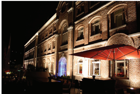
L'hôtel «Verviers» a été inauguré l'été dernier

Un application de la géothermie parfaitement transposable ailleurs, selon Gontran Ninauve,